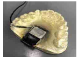
型の人工喉頭「Voice Retriever (ボイス・レトリバー)」により、音を口の中で共鳴させて、口を動かすことで話せるという仕組みです。

銀鈴会会員の多くの方は、電気式人工喉頭(EL)も使用していると伺いましたが、ELは首に自分で押し当てる必要があり、自分たちがみることが多い要介護の方は実質的に使用が困難です。開発中の人工喉頭はマウスピースを口に入れてスイッチを押すだけで話すことができます。声帯の機能を代替するマウスピース